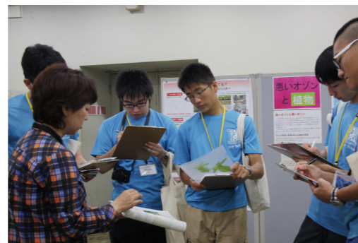
先生の話聞く選手たち

終了後、「普段はなかなか見られない施設を見学できた」と晴れやかな表情を浮かべていた選手たち。班員との絆と共に、動植物への興味をさらに深められたことだろう。(執筆 添島香苗)