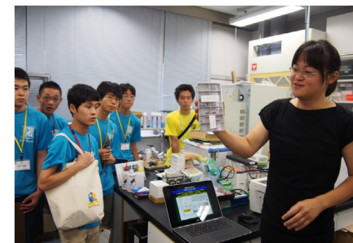
薄膜においセンサーのチップを紹介する様子

一見すると生物から離れたような内容が多かった今回の見学だが、選手たちは「セシウムの可視化という発想が新鮮」「意外と生物が関わっている分野が多く面白かった」などと各自知見を深めており、刺激的な体験となったようだ。(執筆 綿谷光高)